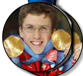
Simon Ammann Skisprung Normalschanze Saut à skis, petit tremplin Skisprung Grossschanze Saut à skis, grand tremplin