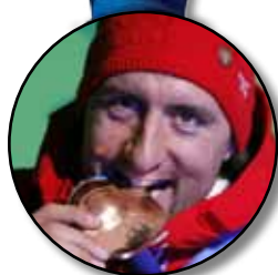
Silvan Zurbriggen Ski alpin Super-Kombination Super-combiné