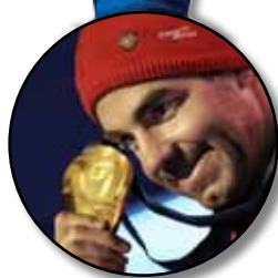
Didier Défago Ski alpin Abfahrt Descente