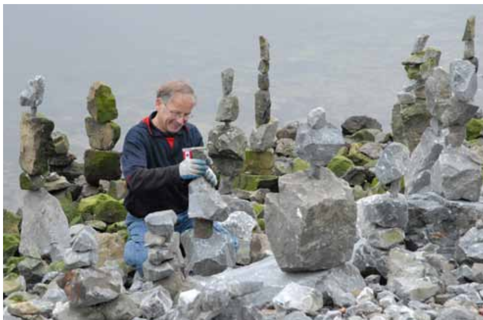
Gesehen in der Stadt: Erbauer von Inukshuks (Steintürmen) am False Creek. Vu en ville : constructeur d'inukshuk (empilement de pierres) à False Creek.