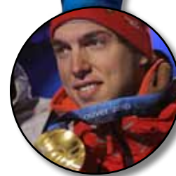
Carlo Janka Ski alpin Riesenslalom Slalom géant