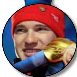
Dario Cologna Skilanglauf 15 km freie Technik Ski de fond, 15 km style libre