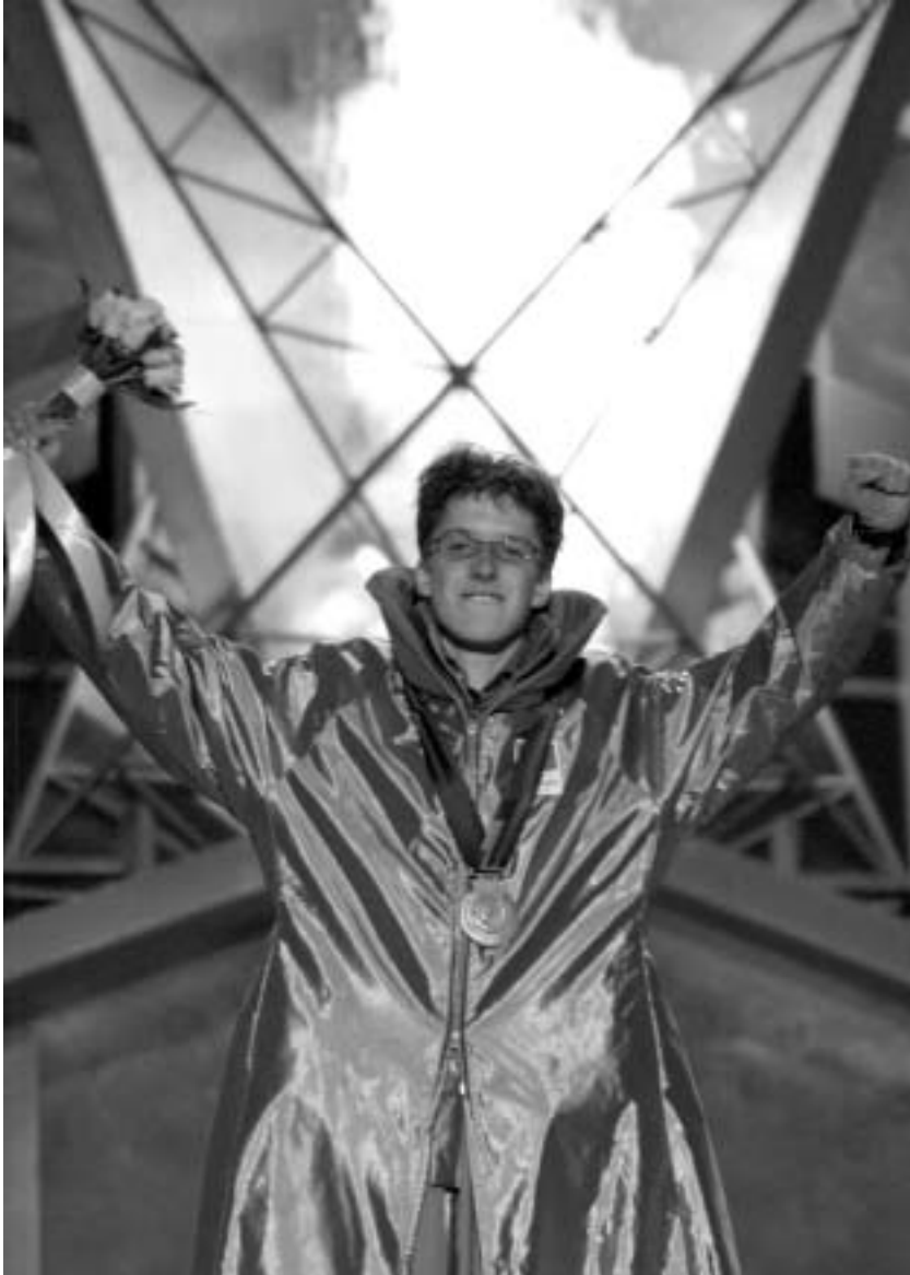
Simon Ammann, Skisprung-Doppel-Olympiasieger von Salt Lake City 2002.

Viele Nachwuchsathleten sind für Visionen zu begeistern! Sie setzen alles daran, ihre Ziele zu erreichen. Dafür brauchen sie unsere Unterstützung.